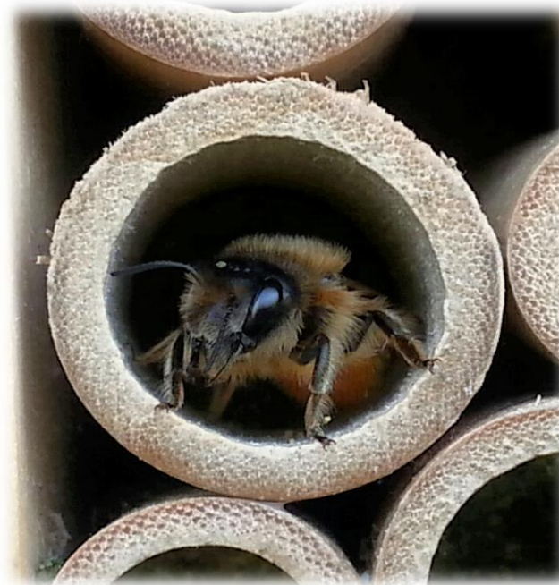
Bild oben links: Schwarzblaue Holzbiene Bild oben rechts: Sandbiene auf Weide Bild unten: Wildbiene in Nisthilfe

Innerhalb des Insektengartens gibt es Nisthilfen und Blumen mit tierischen Bewohnern und Besuchern zu bestaunen.