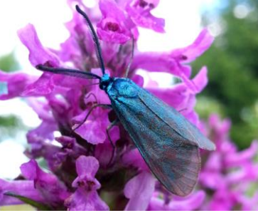
Bild oben links: Grünwidderchen, tagaktiver Nachtfalter Bild oben rechts: Kleiner Fuchs, Tagfalter

Ein Schwerpunkt ist der Insekten- und Vogelschutz. Hier möchten wir den Besuchern ökologische Zusammenhänge nahebringen und gerne auch zum Nachahmen im eigenen Garten ermuntern.