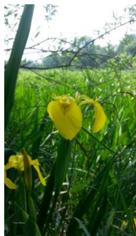
Bild oben: Gebänderte Prachtlibelle Bild rechts: Sumpfschwertlilie am Ufer

Die auf dem Gelände lebenden Knoblauchkröten führen eher ein verstecktes Dasein. Sie suchen zur Paarung die stark bewachsenen Bereiche im Wassergraben auf.